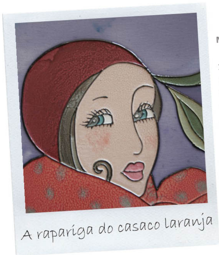
A rapariga do casaco laranja